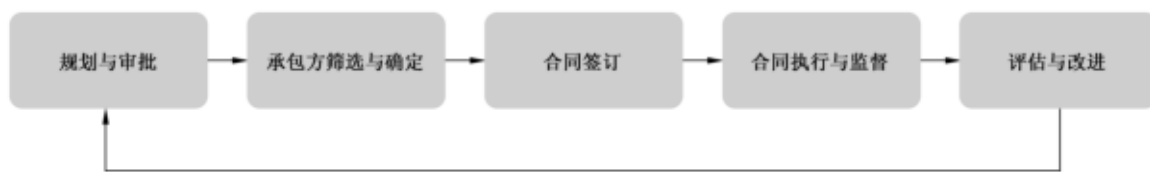
图 2 发包工作过程示意图